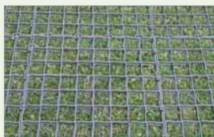
Easy Park acabado de aplicar

O Easy Park® tem apenas 18 mm de altura e é apoiado sobre o relvado já existente, protegendo a superfície verde sem obstaculizar o crescimento da relva, mas evitando a compressão das raízes. A seguir ilustramos a sequência temporal em apenas 10 dias.