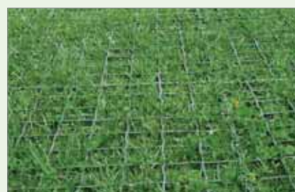
Easy park após 10 dias