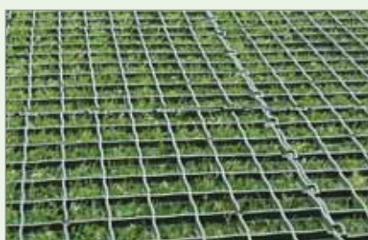
Easy Park após alguns dias