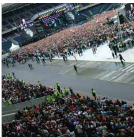
Concerto num estádio