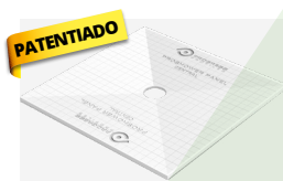
PAINEL CENTRAL DO PROSHOWER PSHPANC