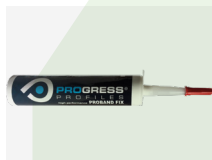
PROBAND FIX PRBFXB