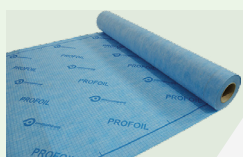
PERFIL PFLO 0405