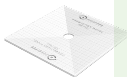
PROSHOWER PAINEL CENTRAL PSHPANC